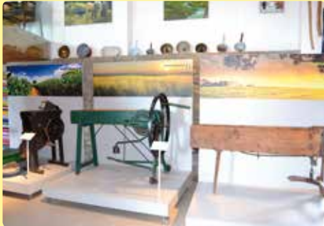
7 mobile Plattformen für Ausstellungsobjekte und 5 Plattformen für Vernissagen.