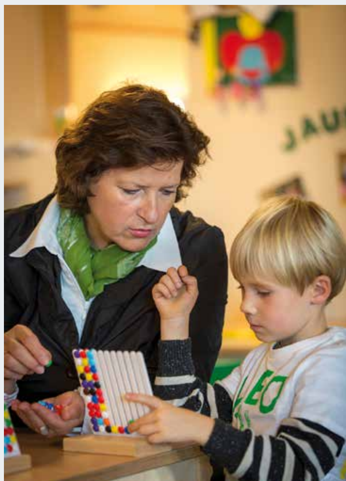
LRin Ursula Lackner zu Besuch in einem Kindergarten.

rätin für Bildung und Gesellschaft (SPÖ). Daher initiierten das Land Steiermark und der Bund eine Ausbauoffensive, in deren Rahmen für die Jahre 2014 bis 2017 60 Millionen Euro zur Verfügung standen. Heuer fließen in der Steiermark weitere neun Millionen Euro an die Gemeinden bzw. Trägerorganisationen. Kürzlich hat die Landesregierung auf Lackners Antrag hin die Auszahlung einer weiteren Tranche an Förderungen beschlossen – unter anderem auch an die Gemeinde Kammern. Sie erhält 39.450 Euro an Unterstützung für den Ausbau des Kindergartens.