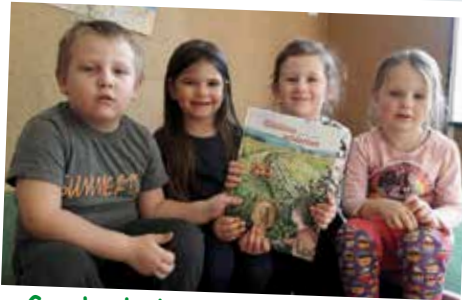
Geschenk des Jagdschutzvereines Der Jagdschutzverein der Ortsstelle Kammern hat dem Kindergarten ein Buch „Wildtiere entdecken“ gespendet. Hiermit möchten wir uns recht herzlich für dieses Geschenk bedanken.