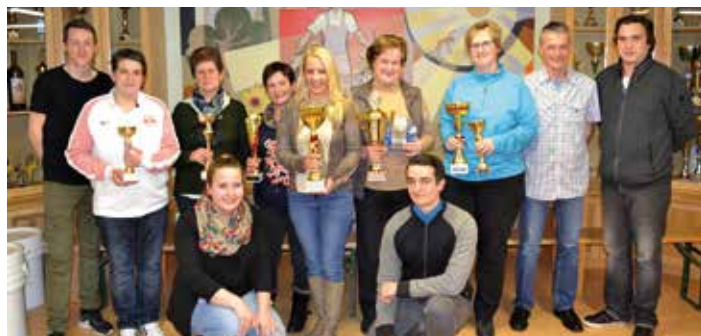
Die Pokalgewinnerinnen im Kreise der Gratulanten.

An diesem Nachmittag freuten sich die SchnapserrInnen jedoch nicht nur auf das Kartenspielen, sondern auch auf die schon traditionelle Verlosung, welche im Anschluss an die Siegerehrung stattfand. Hier wurden 6 Preise im Gesamtwert von € 770,- verlost. Die ersten vier Preise waren Einkaufsgutscheine für „unser Geschäft in Kammern“.