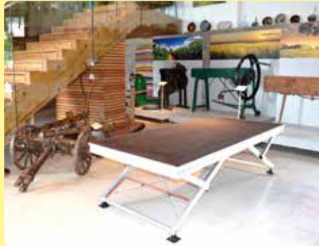
10 verstellbare Bühnenelemente.