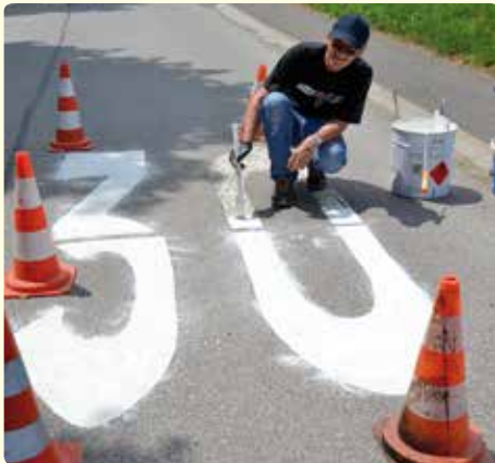
Bitte an die Autofahrer - halten Sie sich an die Geschwindigkeitsbeschränkungen, denn wenn etwas passiert ist, dann ist es leider zu spät!