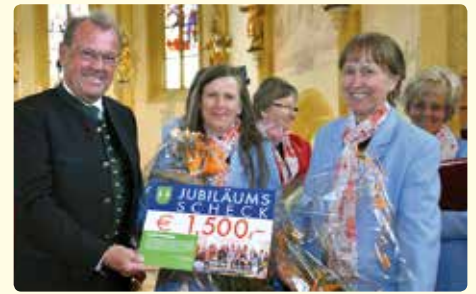
Gratulation dem Singkreis Kammern zum 30-jährigen Bestandjubiläum und Übergabe eines Jubiläumsschecks.