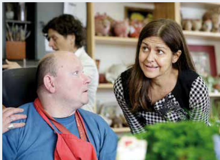
Soziallandesrätin Doris Kampus: „Menschen mit Behinderung sollen so leben, wohnen und arbeiten können wie Menschen ohne Behinderung.“

Einen weiteren Schwerpunkt der Behindertenpolitik bildet der Schulbereich – dazu läuft ein digitales Pilotprojekt in einer Volksschule, in der IT-Expertinnen und -Experten mit Behinderung Kinder mit und ohne Behinderung im schulischen Umgang mit Tablets unterstützen.