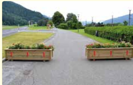
Neue Blumentröge für Bahnhofstraße und Hochstraße wurden von unseren Gemeindemitarbeitern angefertigt.