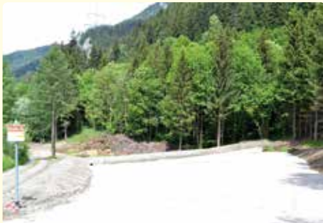
Neue Lagerstätte für Baum- und Grünschnitt. Dieser neue Platz befindet sich unmittelbar vor der bisherigen Lagerstätte. Bitte hier nur Baum- und Grünschnitt ablagern!