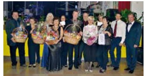
Die glücklichen Gewinner des Schätzspieles.

Eines stand für die Ballbesucher nach der amüsanten und unterhaltsamen Ballnacht auf jeden Fall fest: Sie werden am 12. Jänner 2019 auch den 43. Nelkenball der SPÖ-Kammern wieder gerne besuchen.