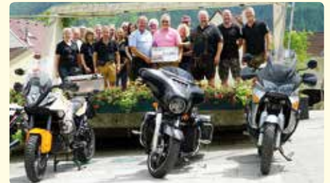
Gratulation den Reiting Bikers zum 20-jährigen Bestandsjubiläum und Übergabe eines Jubiläumsschecks.