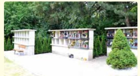
Im Bereich der Urnenwände wurden nun zwischen den einzelnen Segmenten Thujen zur Abgrenzung und damit zur Verschönerung gesetzt.