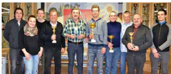
Die Pokalgewinner im Kreise der Gratulanten.