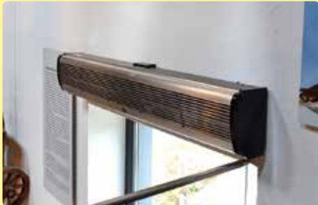
Über dem Haupteingang wurde ein Heizgebläse installiert.