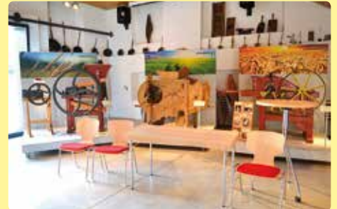
Ankauf von 80 Stück gepolsterten Sesseln, 10 Tischen und 10 runden Stehtischen.