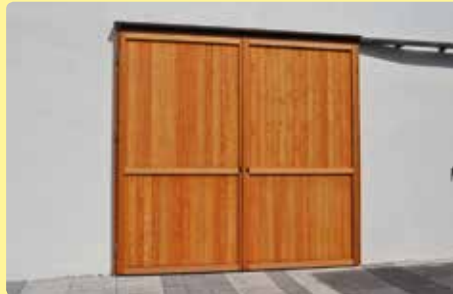
Beim großen Tor in den Museumshof wurde ein neues Holztor eingebaut.