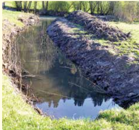
Sanierung des Gerinnes von der ÖBB Bahnstrecke zur Liesing im Fadelgraben.