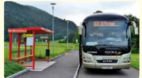
Ab 7. Juli 2018 gibt es nun auch an den Wochenenden sowie an Feiertagen einen verstärkten Busverkehr in das Liesingtal.