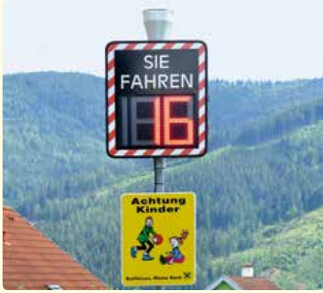
Ankauf eines weiteren Geschwindigkeits-Messgerätes.